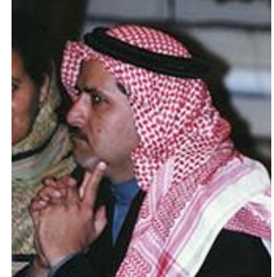
Najdi de Saudi Arabia

Emisoras de radio Cristianas llegan a aproximadamente 91% de la población mundial en el idioma nativo del radio oyente.