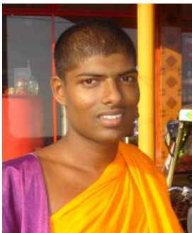
Cingalés de Sri Lanka

El Cristianismo verdadero ha crecido por más de 300 millones creyentes en los últimos diez años. Aproximadamente 10 millones de estos nuevos Cristianos son de Norte América y Europa, y el resto - 290 millones - son de países en desarrollo como Nigeria, Argentina, India y China.