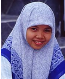
Madura de Indonesia

De los estimados 16,600 grupos étnicos en el mundo, alrededor de 6,700 todavía tienen menos del 2% que son seguidores de Cristo lo que significa que 40% de todos los grupos étnicos son considerados como menos alcanzados.