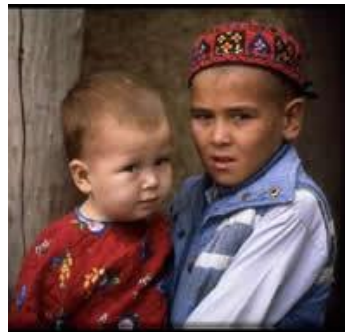
Turcos de Turkmenistán

La persecución activa de cristianos ocurre en muchos países como; Arabia Saudita, el Sudán, Somalia, Marruecos, Birmania, Irán, Libia, Corea del Norte, Argelia, Yemen, Vietnam, Laos, Egipto, China. Más de 250,000 creyentes serán martirizados este año.