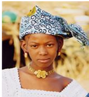
Fula Jalón de Guinea

El Nuevo Testamento ha sido traducido al idioma materno de más de 87% de la población mundial. Sin embargo el aproximadamente 13% restante necesitará más de 1,800 nuevas traducciones. Las agencias de traducción Bíblica esperan haber empezado todas las traducciones para el 2025.