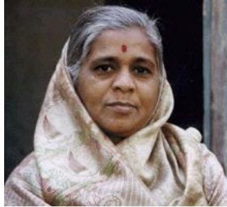
Marata de India

7.2 millones, Musulmanes Suní, No Alcanzadas ●